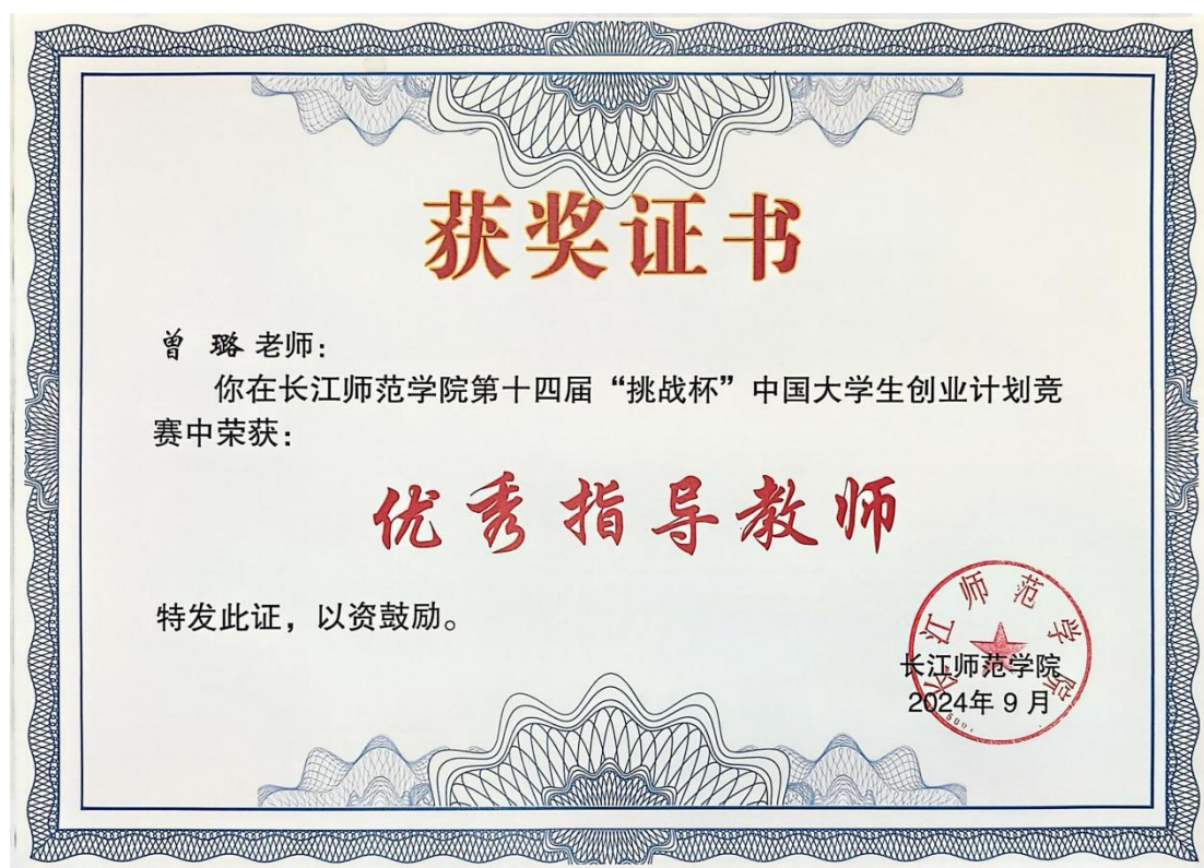
8. 长江师范学院-“挑战杯”优秀指导教师