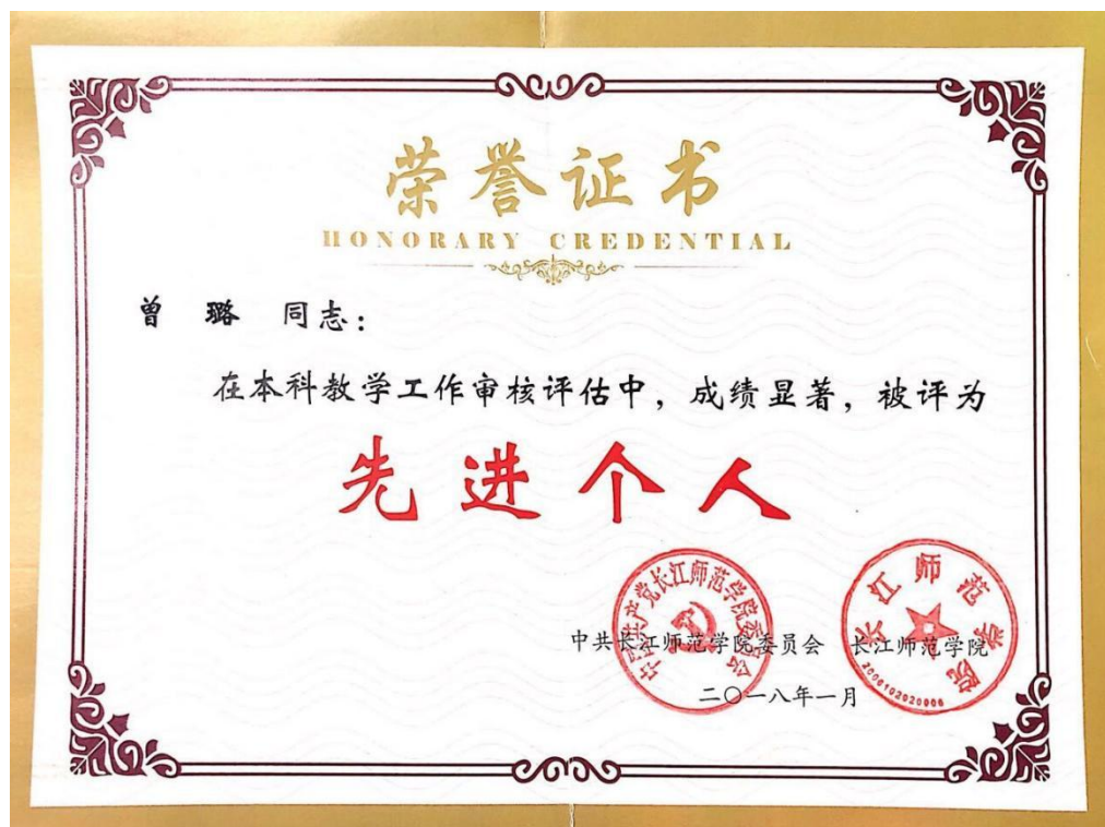
3.长江师范学院-先进个人