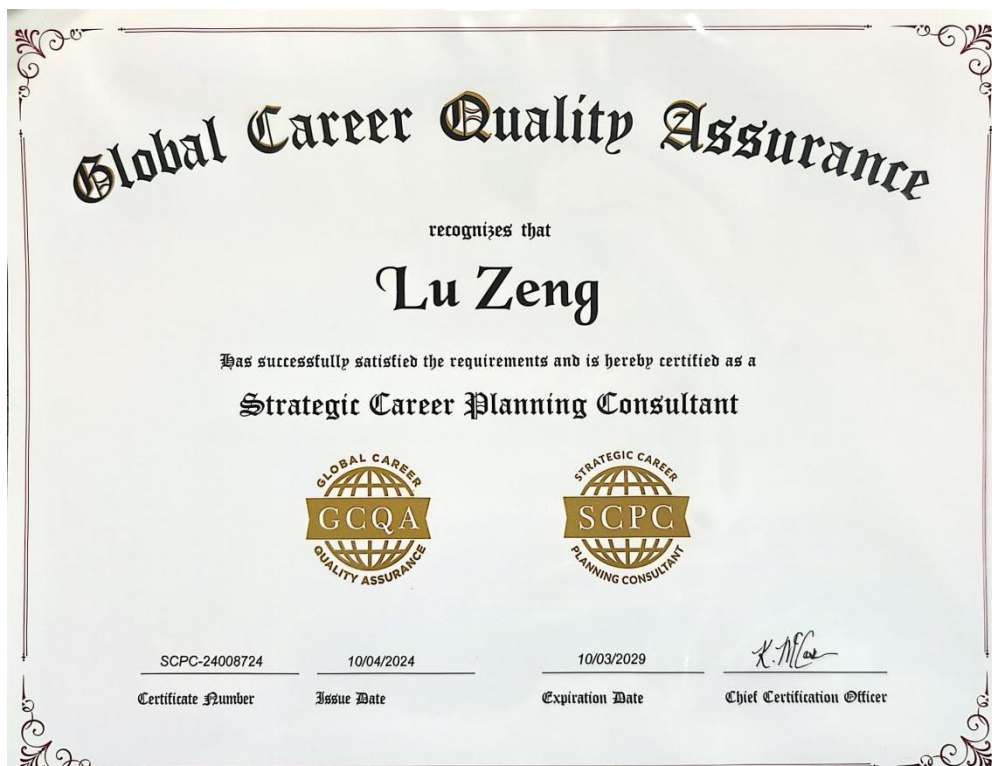
2.SCPC 国际职业策略规划师