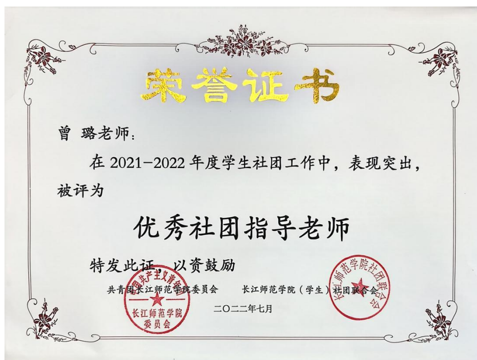
6. 共青团长江师范学院委员会-优秀社团指导老师 2022