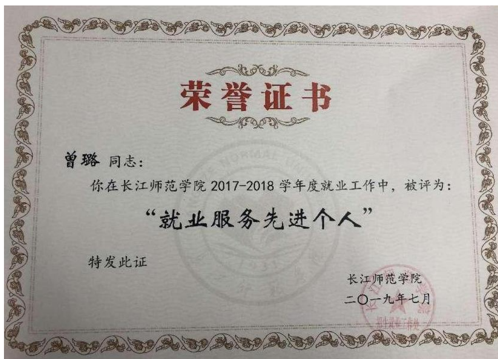
4.长江师范学院-就业服务先进个人