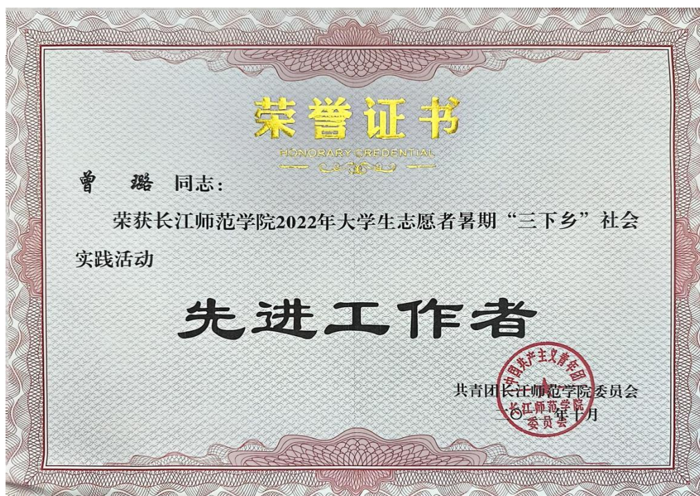
5.共青团长江师范学院委员会-“三下乡”先进工作者