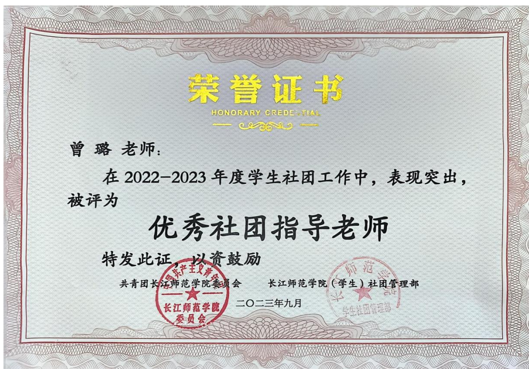
7. 共青团长江师范学院委员会-优秀社团指导老师 2023